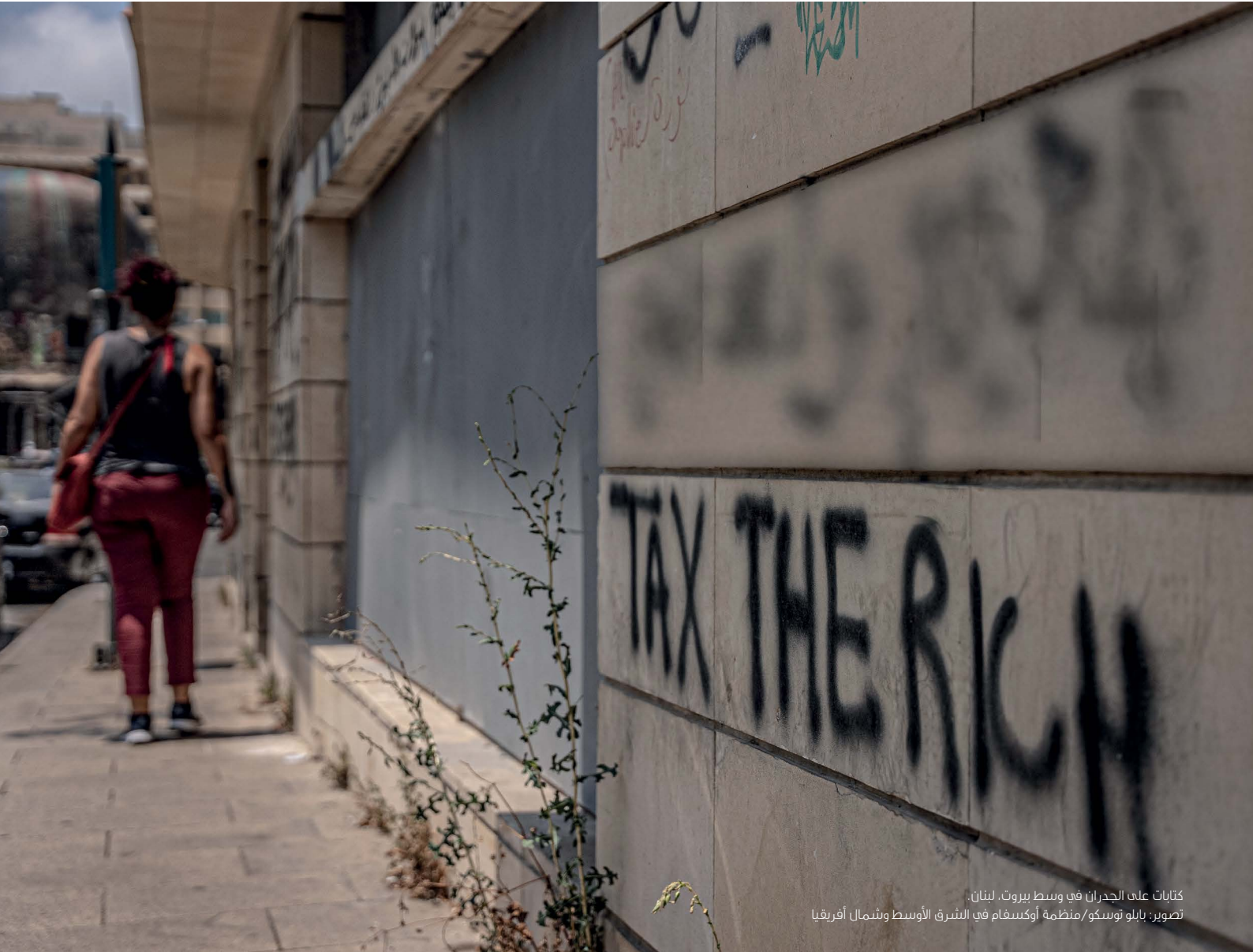
كتابات على الجدران في وسط بيروت، لبنان.

يمكننا أن نجعل عالمنا مكانًا أفضل؛ ولكن علينا فقط أن نجد الإرادة السياسية للقيام بما يلزم.