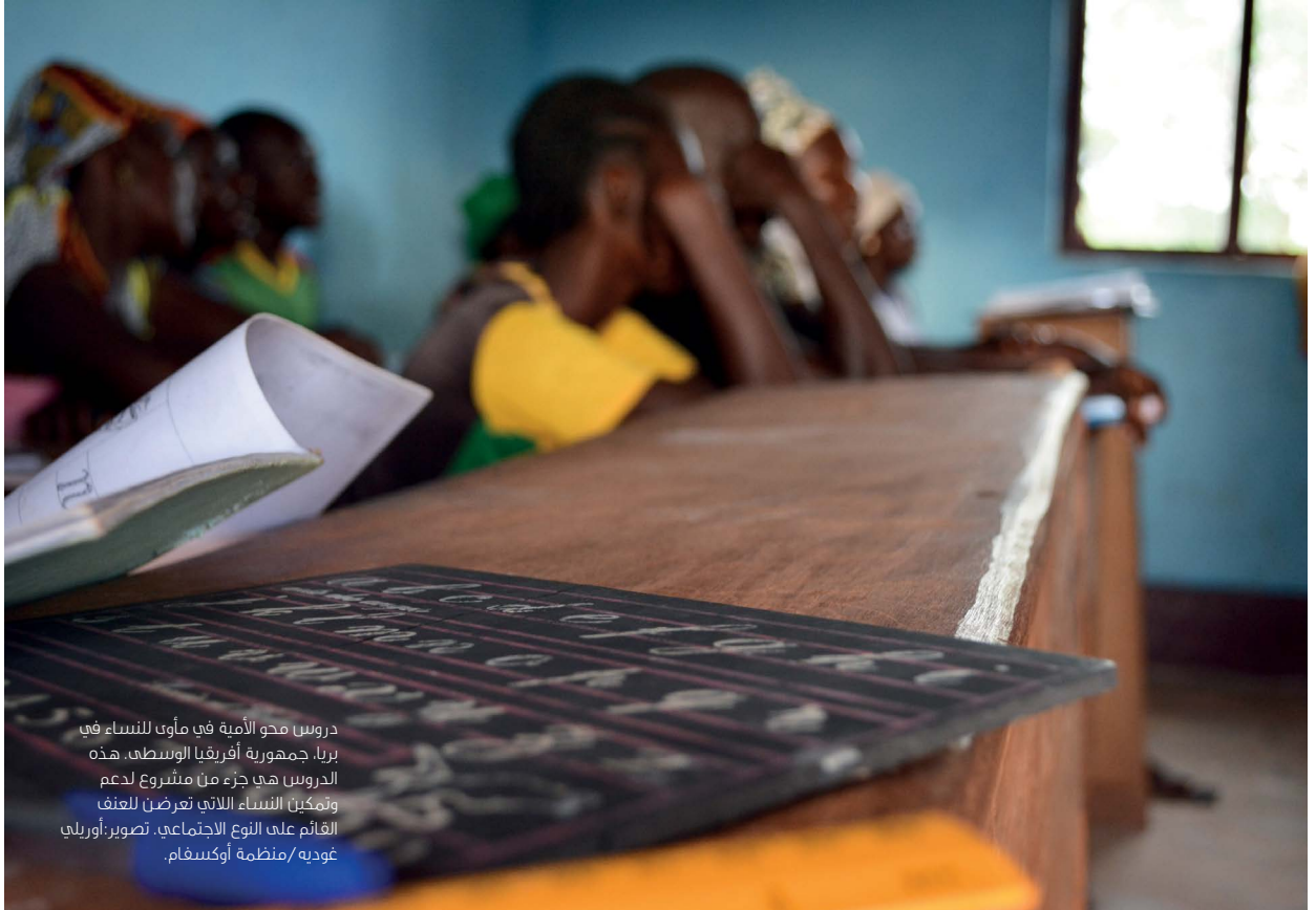
دروس محو الأمية في مأوى للنساء في برنا، جمهورية أفريقيا الوسطى. هذه الدروس هي جزء من مشروع لدعم وتمكين النساء اللاتي تعرضن للعنف القائم على النوع الاجتماعي.

على الحكومات أيضًا أن تعيد كتابة قواعد اقتصاداتها التي تخلق مثل هذه الانقسامات الهائلة، وأن تعمل على التوزيع المسبق للدخل، وتغيير القوانين، وإعادة توزيع السلطة في اتخاذ القرار والقوة الاقتصادية.